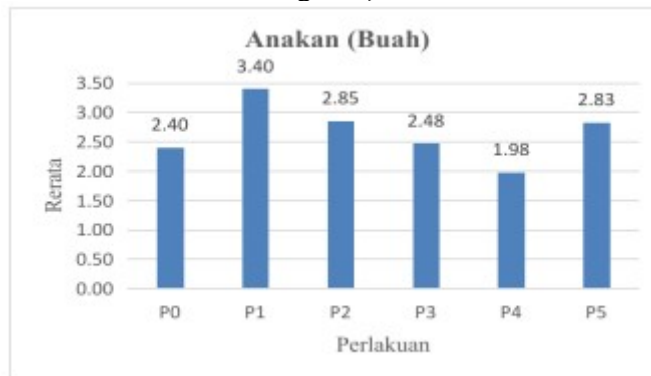
Gambar 3. Diagram Jumlah Anakan

Menurut Guntoro(2003) kandungan unsur hara P pada pupuk organik akan meningkatkan jumlah anakan tebu sampai dosis optimum dan akan berkurang jika dosis ditingkatkan. Selain itu rendahnya kandungan unsur hara P pada pupuk organik cair lamtoro yakni sebesar 0,2% belum dapat memberikan pengaruh pada penambahan jumlah anakan bibit tebu.