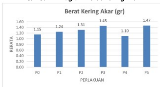
Gambar 4. Diagram Berat Kering Akar

Pupuk organik cair lamtoro yang digunakan ini mengandung kalium yang cukup untuk memberikan sedikit pembeda dengan perlakuan kontrol pada berat kering tanaman. Unsur hara kalium (K) berguna dalam membentuk akar baru yang akan digunakan dalam menyerap air dan hara di dalam tanah untuk memperlancar proses fotosintesis. asimilasi cukup banyak memungkinkan biomassa tanaman yang lebih banyak, yang berkaitan dengan berat akar kering yang dihasilkan.