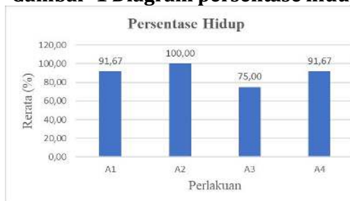
Gambar 1 Diagram persentase hidup

Hasil pengamatan parameter persentase hidup menunjukkan setiap parameter yang diujikan memiliki nilai rata-rata persentase hidup kurang dari 50%dengan nilai rata-rata paling tinggi pada perlakuan A3 yaitu 16,67 %. Hal ini diduga karena kualitas akar yang kurang baik sehingga tanaman kurang dapat menyerap nutrisi yang ada pada media tanam. Kematian akar ditandai dengan perubahan warna akar yang menghitam dan struktur akar yang layu. Selain itu saat ditekan, akar memiliki struktur yang lunak dan berair. Menurut Yunita et al. (2016).