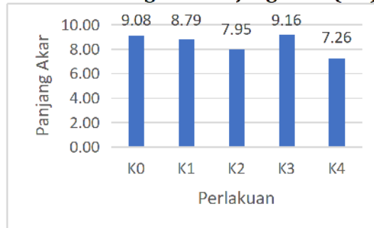
Gambar 2 Diagram Panjang Akar (cm)

Penggunaan bahan tanam satu ruas pada setek lada juga berpengaruh terhadap percepatan pertumbuhan akar pada setek. Hal ini dikarenakan semakin sedikit bahan tanam yang digunakan maka semakin sedikit cadangan makanan yang dibutuhkan tanaman untuk bertahan hidup, sehingga cadangan makanan yang ada dapat disalurkan untuk pertumbuhan akar.