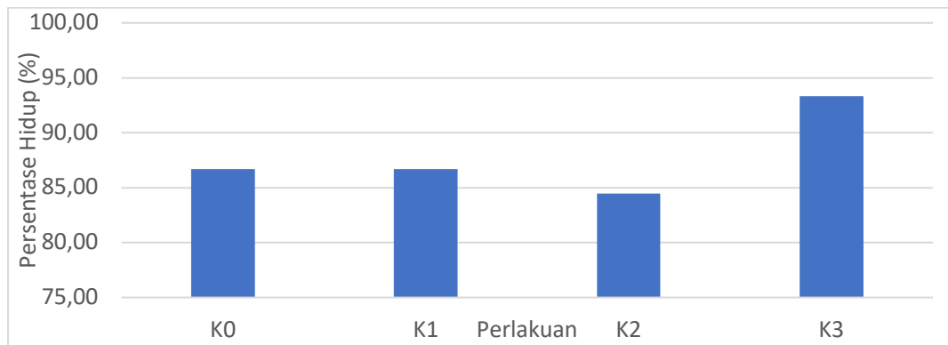
Gambar 1 Diagram Persentase Hidup Bibit Lada

Berdasarkan hasil analisis ragam pada Gambar 4.1 menunjukkan bahwa persentase hidup stek tertinggi terdapat pada perlakuan K0P1, K1P2, K3P1, K3P2, dan K3P3 memiliki rerata 93,33%, pada perlakuan K0P2, K1P3, K2P2, K2P3 memiliki rerata 86,67%, sedangkan pada perlakuan K0P3, K1P1 memiliki rerata 80%. Berdasarkan hasil analisis ragam dengan menggunakan rancangan acak kelompok faktorial (RAK) menunjukkan bahwa lama perendaman dalam ekstrak bawang merah dan interaksi kedua faktor tersebut tidak memberikan pengaruh yang nyata terhadap tingkat kelangsungan hidup stek lada