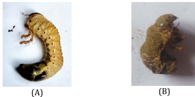
Gambar 3. Perbandingan Fisik Antara (A) Hama Uret Sehat dan (B) Hama Uret yang Terinfeksi M. anisopliae

ditutup kembali dengan tanah. Metode pengaplikasian seperti ini akan membuat cendawan M. anisopliae dapat menginfeksi hama uret secara kontak. Berikut merupakan hasil pengamatan yang menunjukkan perbandingan antara bentuk fisik hama uret sebelum dan sesudah pengaplikasian M. anisopliae .